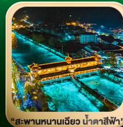
“สะพานหนานเฉียว น้ำคาสีฟ้า”