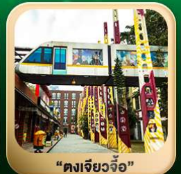
“ดงเจียวจื่อ”