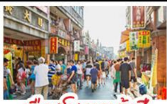
เมืองโบราณต้าซี