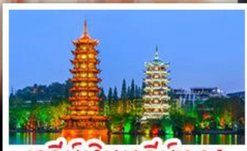
เจดีย์เงินเจดีย์ทอง