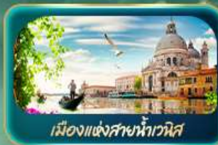
เมืองแห่งสายน้ำเวนิส

จุดบรรจบความอลังการของธรรมชาติ Dolomites และ ทะเลสาบมิซูร์น่า ชมน้ำสิเกอร์ครอยซ์ ทะเลสาบเบรียส สูดโรแมนติกเมืองแห่งสายน้ำเวนิส ห้ามพลาด มหาวิหารดูโอโมแห่งมิลาน โรมัน ฮาร์น่า บ้านของจูเลียต เที่ยวลูเซิร์น ชมสิงโตหินแกะสลัก เดินเล่นสะพานไม้อาเปลา อินส์บรุค ย้อนอดีตกับเฮาเซนด์แอนน์ หลังคาทองคำ ช้อปปิ้ง Outlet