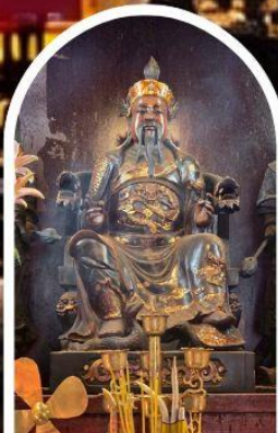
วัดปักไต

ขอเทพเจ้ากวนอู ความซื่อสัตย์ เงินทอง ธุรกิจมั่นคง