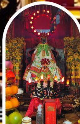
วัดเจ้าแม่กวนอิมอ่องฮำ

เสริมโชคลากนำความรุ่งเรืองทุกด้านของชีวิต