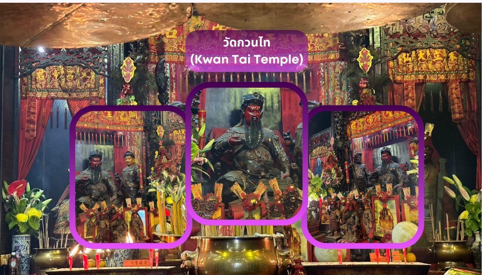
วัดกวนไท (Kwan Tai Temple)

โดยแจ้งปี ค.ศ. แก่เจ้าหน้าที่ภายในวิหาร เพื่อทำการตรวจแผนภูมิดวงชะตาและแนะนำองค์พระประจำปีเกิดที่ถูกต้อง ทั้งนี้ ในแต่ละราศีและแต่ละปีเกิด จะมีพระประจำปีรวม 5 องค์ ซึ่งล้วนมีความหมายและพลังคุ้มครองแตกต่างกันไป โดนจะมีโถงและเจ้าหน้าที่ประจำวิหารคอยนำการทำพิธีอย่างละเอียด ตามหลักความเชื่อดั้งเดิมของชาวท้องถิ่น เพื่อให้การสักการะถูกต้อง ครบถ้วน และเปี่ยมไปด้วยความศรัทธา