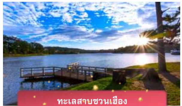
ทะเลสาบชวนเอื้อง

ที่พัก The Western Hill ระดับ 4 ดาวหรือเทียบเท่า