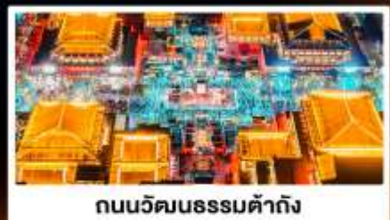
ถนนวัฒนธรรมต้าถิง