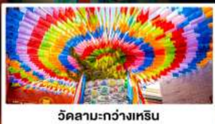
วัดลามะกว้างเหริน