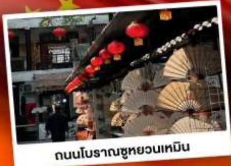
ถนนโบราณซูหยวนเหมิน

"มรดกโลกพันปี สุสานทหารดินเผา" แต่งชุดจีนโบราณ เดินถนนวัฒนธรรมต้าถิง