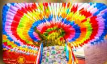
วัดลามะกว้างเหริน