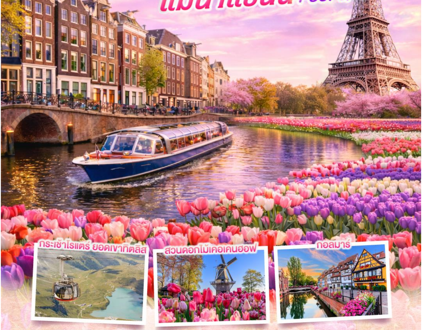
กระเช้าไรเตร ยอดเขาทิตลิส