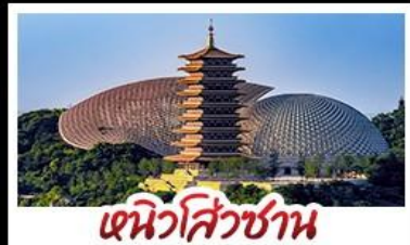
ตึกไขว้ชาน