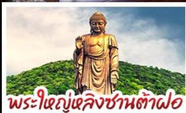
พระใหญ่หลังสวนต้าฟอ