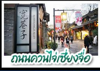
ถนนควนหนี่จ๋อเซียงจื่อ