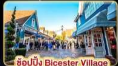
ช้อปปิ้ง Bicester Village