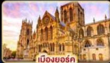
เมืองยอร์ก