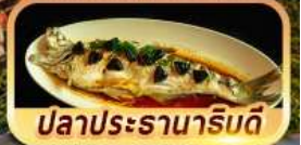
ปลาประจักษ์ริบตี