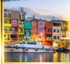
ท่าเรือประมงเจิ้งปิง