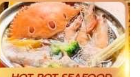
HOT POT SEAFOOD