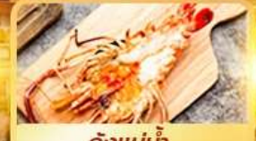
กุ้งแม่น้ำ