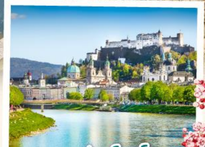
ซาลซ์บวร์ก