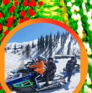
ขี่ SNOW MOBILE