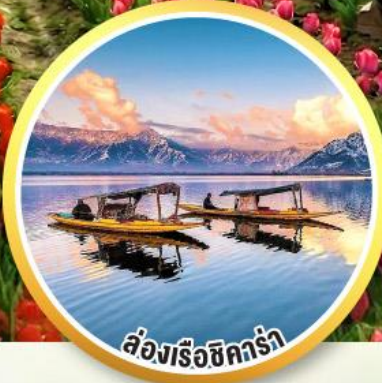
ล่องเรือชิคร่า