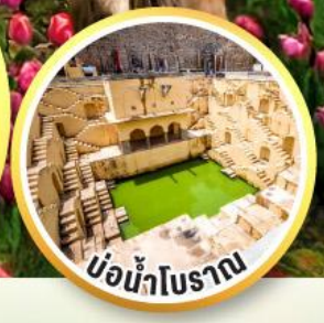
บ่อน้ำโบราณ