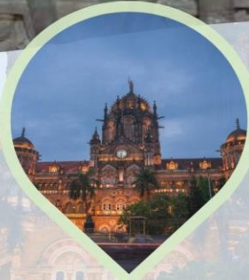
ชม Victoria Terminus สถานีรถไฟประวัติศาสตร์และเป็น มรดกโลกของยูเนสโก