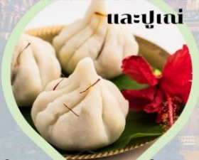
รับชุดสักการะฟรี! ท่านละ 1 ชุด