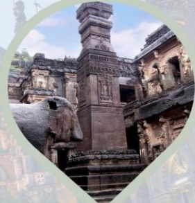
มหัศจรรย์ถ้ำไทรลาส ไฮไลท์ ถ้ำ เอลโลรา