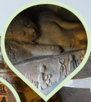
นั่งชมถ้ำพระพุทธศาสนา เทวสถานอชันต้า