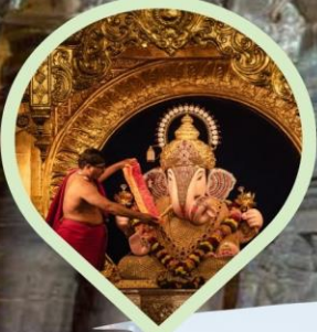
สักการะองค์พระพิฆเนศวร ศักดิ์สิทธิ์ประจำเมืองมุมไบ และปูणे