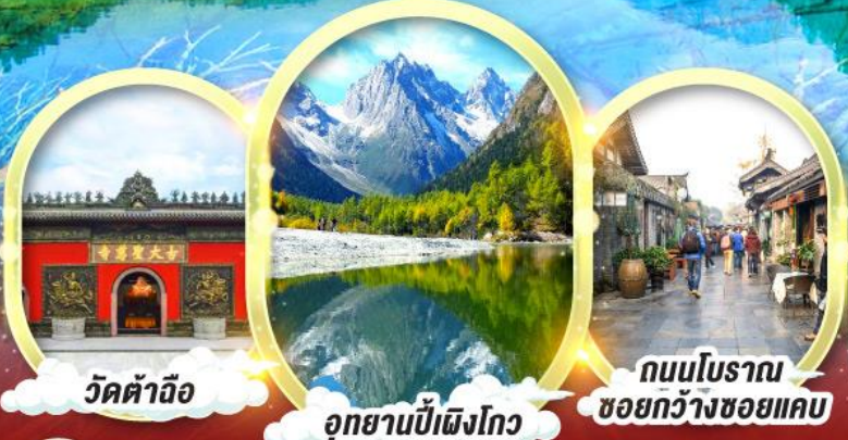
วัดค้ำอ้อ