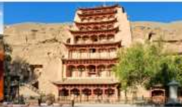
ต้าเถะสลิกม่อเถาสุ