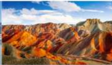
หุบเขาสายรุ้งจางเย่