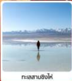
ทะเลสาบชิงไห่