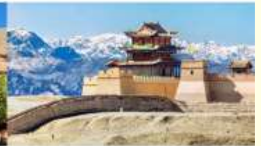
กำแพงเมืองจีน ด่านเจียหยวีกวน

*ทางบริษัทฯ ขอสงวนสิทธิ์ในการสลับโปรแกรมทัวร์ตามความเหมาะสมขึ้นอยู่กับสถานการณ์หน้างาน โดยคำนึงถึงผลประโยชน์ของลูกค้าเป็นสำคัญ