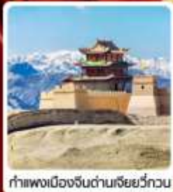
กำแพงเมืองจีนด่านเสี่ยววีกวน

• ไฮไลท์...เส้นทางสายไหม ชมสระบัววังพระจันทร์ ทะเลทรายหิงซาซาน กำแพงเมืองจีนด่านสุดท้าย "เจียยวีกวน" มรดกโลกภูเขาสายรุ้งจางเย่