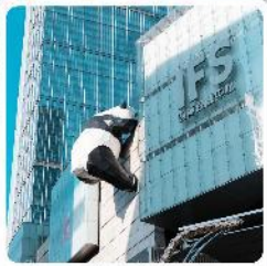
IFS ตึกหมีแพนด้า

● ไอโกล์ นั่งกระเช้าขึ้นชมกุหลาบหิมะวาจู่ ซื้อมั้กนบนซุนซีลู่ แลนด์มาร์คแพนด้ายักษ์เป็นตึก IFS เจ็ดตุ