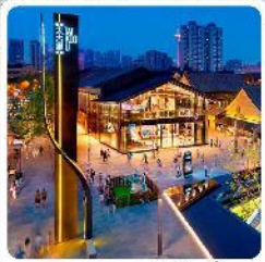
ถนนคนเดินไท่กุหลี่