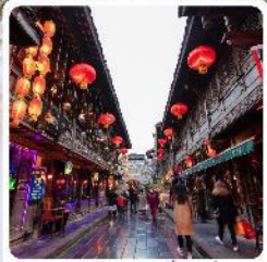
ถนนโบราณจีนหลี