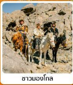
ชาวมองโกล