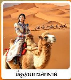
ขี่อูฐชมทะเลทราย