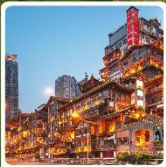
หงหยาดิง