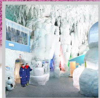
“KAMIKAWA ICE PAVILLION”