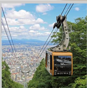
“MT. MOIWA ROPEWAY”