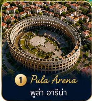
1 Pula Arena พู่ลา อาร์น่า