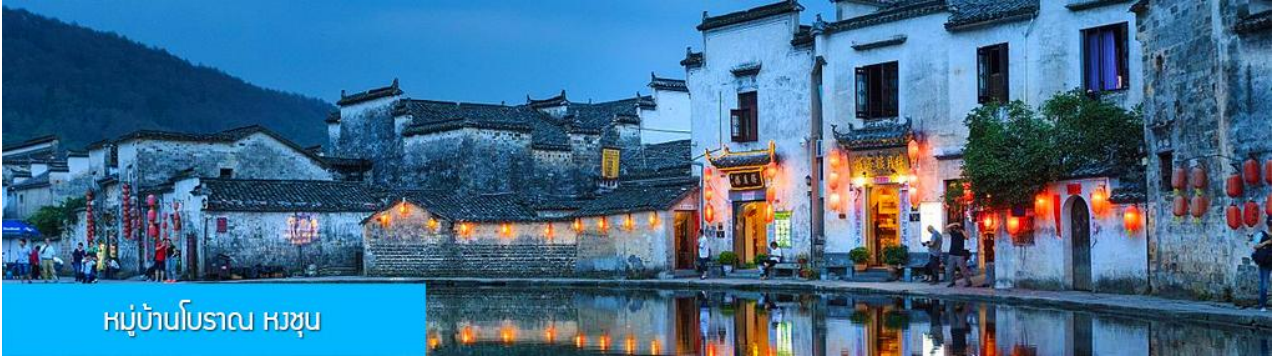
หมู่บ้านโบราณ หงซุน

พักที่ โรงแรม JIANGNAN HAOTING HOTEL ระดับ 4 ดาวท้องถิ่นหรือเทียบเท่าในเมืองซ่งเหรา