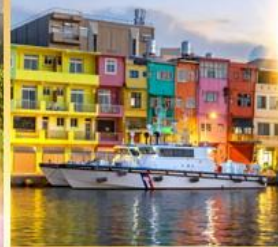
ท่าเรือประมงเจิ้งปิน