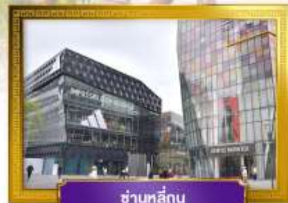
ชานหลู่กู่