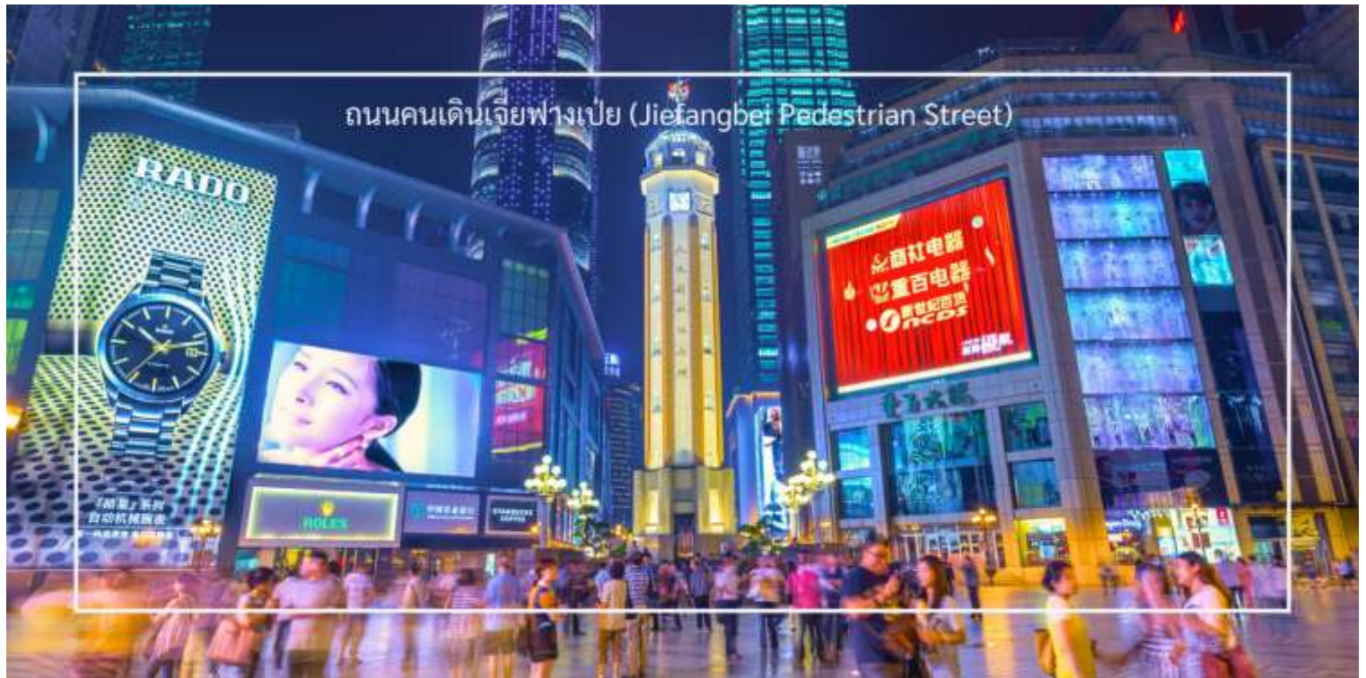
ถนนคนเดินเจียงเป่ย์ (Jiefangbei Pedestrian Street)

และการแสดงต่างๆ ที่ทำให้บรรยากาศน่าสนใจยิ่งขึ้น และยังเต็มไปด้วยร้านค้าแบรนด์เนม ร้านค้าท้องถิ่น และตลาดที่ขายสินค้าต่างๆ เช่น เสื้อผ้า เครื่องประดับ และของที่ระลึก แวะชมร้าน POP MART ร้านดังจากจีน ที่รวมฟิกเกอร์ดีไซน์เก๋และตุ๊กตาน่ารักหลากหลายซีรีส์ยอดนิยม เช่น Molly, Dimoo, Labubu และอีกมากมาย ที่สายสะสมของเล่นไม่ควรพลาด