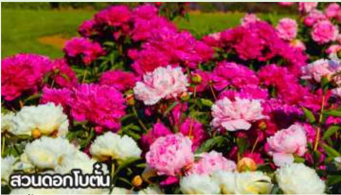
สวนดอกไม้ต้น

เดือนสิงหาคม-ต้นกันยายน ชมทุ่งดอกเบญจมาศหรือดอกไฮเดรนเยีย ดอกเบญจมาศปักกิ่งหมายถึงสายพันธุ์เบญจมาศที่มีต้นกำเนิดหรือนิยมปลูกในกรุงปักกิ่ง ประเทศจีน โดยเฉพาะช่วงฤดูใบไม้ร่วง ที่มีการจัดงานมหกรรมดอกเบญจมาศ แสดงความหลากหลายของสีและรูปทรง มีสายพันธุ์เช่น "กุสุยจินเสี่ย" ที่ได้รับรางวัลราชาดอกเบญจมาศ และยังมีเบญจมาศปักกิ่งสีขาวที่เป็นสมุนไพรด้วย ที่สำคัญคือเป็นดอกไม้ที่ใช้ในงานเทศกาลและวัฒนธรรม โดยเฉพาะในสวนสาธารณะ เช่น รือถาน และอุทยานเป่ย์ไห่ มีหลากหลายสี เช่น ขาว เหลือง ชมพู แดง และม่วง สามารถพบได้ในหลายพื้นที่