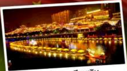
เมืองโบราณเซียงเอน

เที่ยว 2 เมือง จางเจียเจีย & เอนซือ ล่องเรือแคนยอนผิงซาน เที่ยวหุบเขาอวตาร