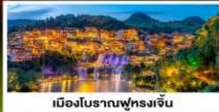
เมืองโบราณฟุทงเจิ้น