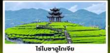
ไร่ชาอูโตเจีย