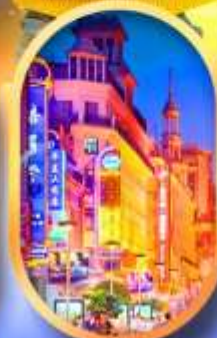
ถนนหนานกิง