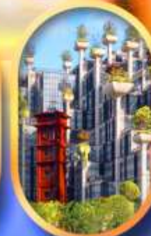
อาคาร 1,000 คัดไม้