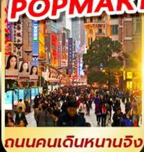
ถนนคนเดินหนานจิง

บินฟูลเซอร์วิส ซุปสุดฟิน POPMART ♥ MINISO LAND