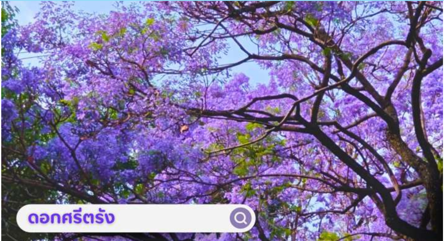
ดอกศรีตรัง

เดือนกันยายน: นำท่านชม ตลาดดอกไม้ไต้หวัน เป็นตลาดค้าส่งดอกไม้ที่ใหญ่ที่สุดของจีน เปิดทำการค้าตลอด 24 ชั่วโมง ไม่มีช่วงเวลาปิดทำการ โดยในปี 2566 ตลาดดอกไม้ไต้หวันมีปริมาณการซื้อขายดอกไม้โดยเฉลี่ยรวม 13,540 ล้านบาท คิดเป็นมูลค่า 13,570 ล้านบาท ถือเป็นตลาดค้าปลีก-ส่ง ผลิตผลทางการเกษตรที่ใหญ่ที่สุดในประเทศจีนอีกด้วย