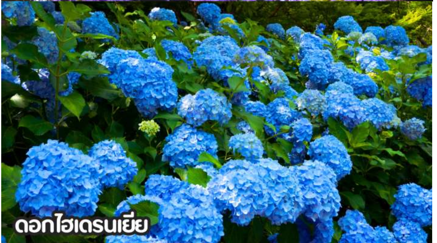
ดอกไฮเดรนเยีย

**หมายเหตุ: โปรแกรมชมดอกไม้ช่วงเดือน พ.ค. - ต.ค.2569 ในช่วง ณ วันเดินทางดังกล่าว หากดอกไม้ยังไม่บานหรืออาจจะร่วงหล่น..ทั้งนี้ขึ้นอยู่กับสภาพอากาศของแต่ละปี ทางบริษัทไม่ประกันติและไม่สามารถกำหนดการบานของดอกไม้ได้ ทางบริษัทฯ ขอสงวนสิทธิ์ปรับเปลี่ยนรายการท่องเที่ยวอื่นทดแทนนะคะ รบกวนท่านโปรดทราบและทำความเข้าใจค่ะ**