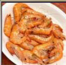
กุ้งหวานลวก