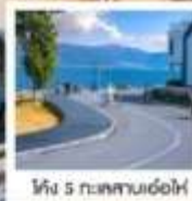
ทะเลสาบ 5 กม. ด้าหลี่