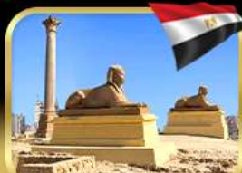
เสาสีมันปอมเปย์