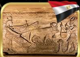
สุสานใต้ดินอเล็กซานเดรีย

เข้าชมพิพิธภัณฑ์อียิปต์แห่งใหม่ (GRAND EGYPTIAN MUSEUM)