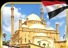
มัสยิดโมฮัมหมัดอาลี