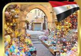
ตลาดชานอลคาลิ