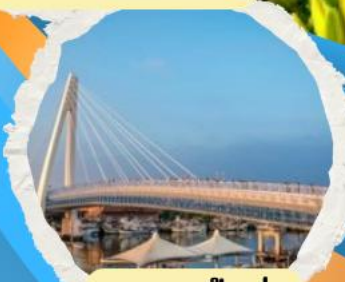
สะพานต้งสู่ย