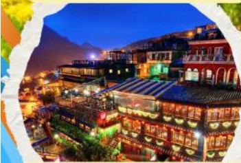
หมู่บ้านโบราณฉิวเฟิ่น