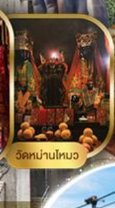
วัดหนานโทว