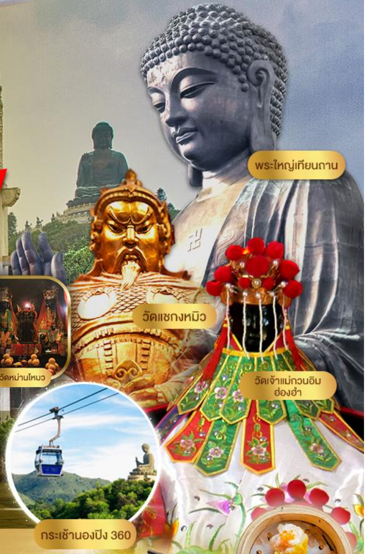
พระใหญ่เทียนถาน