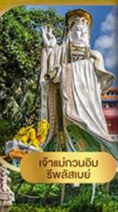
เจ้าแม่กวนอิม ริวสิสเมซ