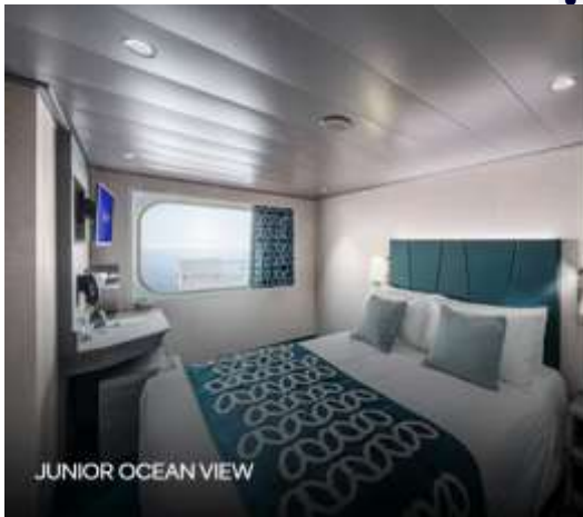
JUNIOR OCEAN VIEW