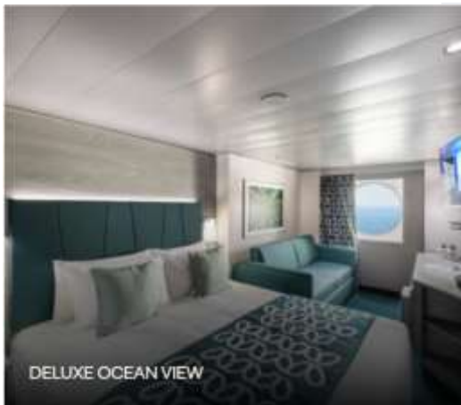
DELUXE OCEAN VIEW