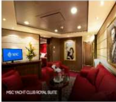
MSC YACHT CLUB ROYAL SUITE