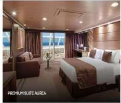
PREMIUM SUITE AUREA