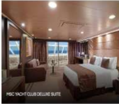
MSC YACHT CLUB DELUXE SUITE