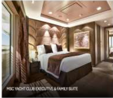
MSC YACHT CLUB EXECUTIVE & FAMILY SUITE