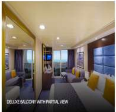
DELUXE BALCONY WITH PARTIAL VIEW