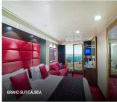
GRAND SUITE AUREA