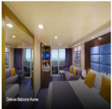
Deluxe Balcony AUREA