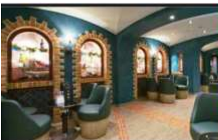
LA CANTINA DI BACCO