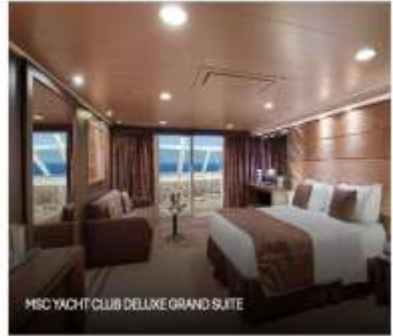
MSC YACHT CLUB DELUXE GRAND SUITE