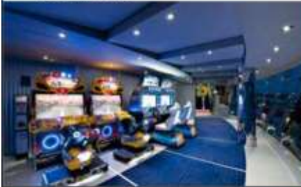
VIDEO GAMES ARCADE