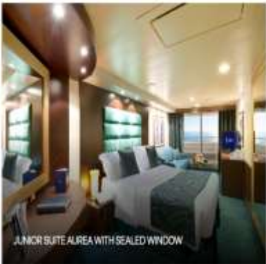
JUNIOR SUITE AUREA WITH SEALED WINDOW