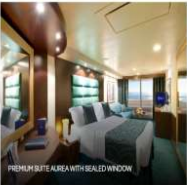
PREMIUM SUITE AUREA WITH SEALED WINDOW