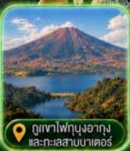
ภูเขาไฟกุงอากังและทะเลสาบมาเตอร์