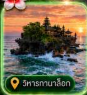
วิหารกานาล็อก

เริ่มต้น 15,999 บาท/ท่าน ราคาไม่รวมตั๋วเครื่องบิน