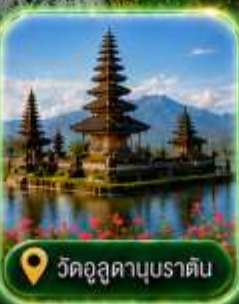
วัดอุสุคานูบราตัม